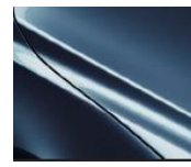
45B Eternal Blue