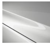
25D Snowflake White Pearl