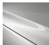
A4D Arctic White