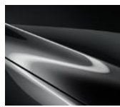
46G Machine Gray