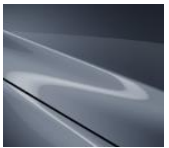
47C Polymetal Gray