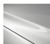
25D Snowflake White Pearl