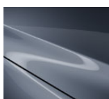
47C Polymetal Gray (ainult luukpäral)