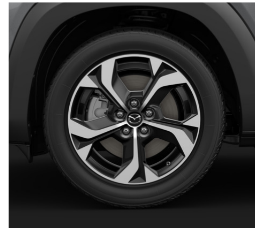
18-tollised "Black Diamond Cut" viimistlusega valveljed 215/55R18