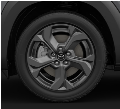
18-tollised "Grey Metallic" viimistlusega valveljed 215/55R18