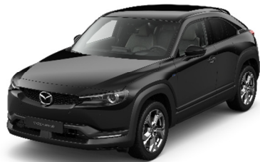
41W Jet Black