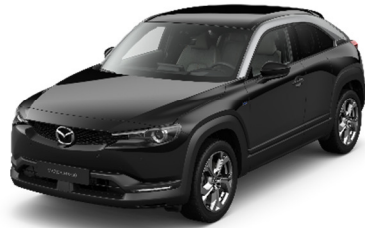
49P Jet Black - Silver