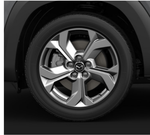
18-tollised heledad "Bright" viimistlusega valveljed