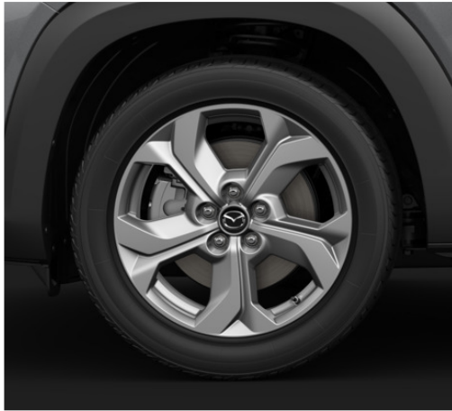
18-tollised hõbedase "Silver" viimistlusega valveljed 215/55R18