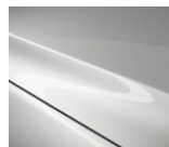
25D Snowflake White Pearl