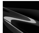
41W Jet Black