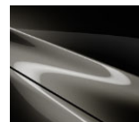
42S Titanium Flash