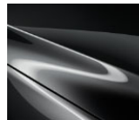
46G Machine Gray