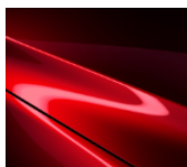
46V Soul Red Crystal