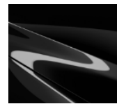
41W Jet Black