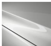
A4D Arctic White