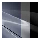
47L Polymetal Gray