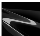
41W Jet Black