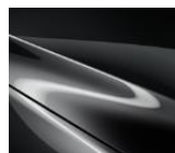
46G Machine Gray