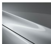
45P Sonic Silver