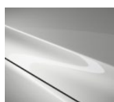
A4D Arctic White