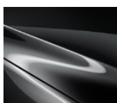
46G Machine Gray