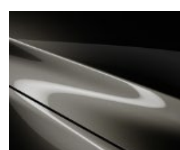
42S Titanium Flash