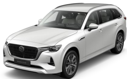
51K Rhodium White