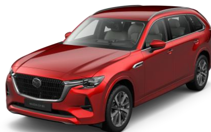
46V Soul Red Crystal