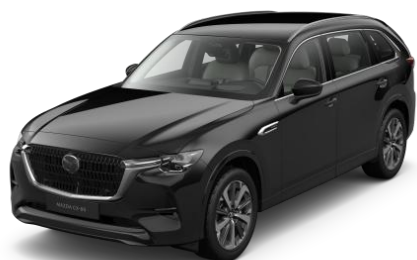
41W Jet Black