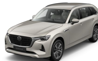
47S Platinum Quartz