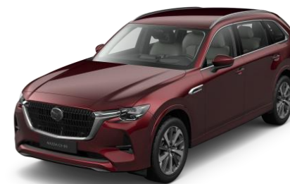
51F Artisan Red