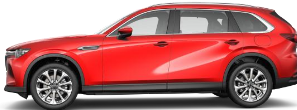
20-tollised hõbedase "Bright" viimistlusega valuveljed (235/50R20)