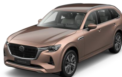
52H Melting Copper