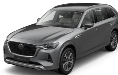
46G Machine Grey