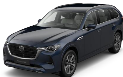
42M Deep Crystal Blue