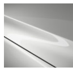
A4D Arctic White