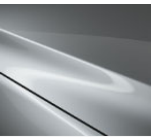
45P Sonic Silver