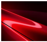
46V Soul Red Crystal