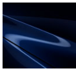
42M Deep Chrystal Blue