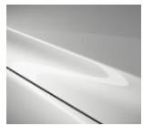
25D Snowflake White Pearl