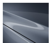
47C Polymetal Gray