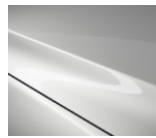
25D Snowflake White Pearl