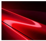
46V Soul Red Crystal