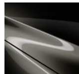
42S Titanium Flash