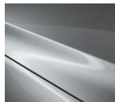
45P Sonic Silver