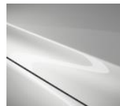
25D Snowflake White Pearl