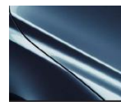
45B Eternal Blue Metallic