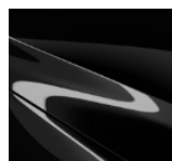
41W Jet Black