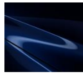
42M Deep Chrystal Blue