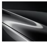
46G Machine Gray