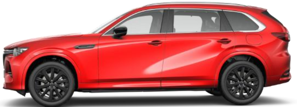
20-tollised musta "Black" viimistlusega valuveljed (235/50R20)