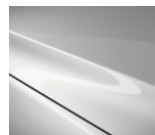
25D Snowflake White Pearl

Варианты цвета Metallic по дополнительному заказу (цена — 700 евро)