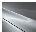
45P Sonic Silver