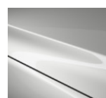
A4D Arctic White

Варианты цвета Metallic по дополнительному заказу (цена — 700 евро)