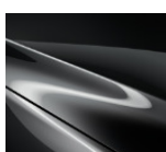
46G Machine Gray