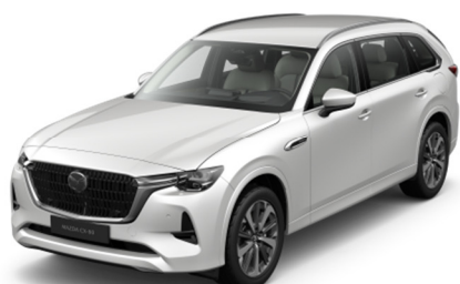
51K Rhodium White

Варианты цвета Premium Metallic по дополнительному заказу (цена — 1000 евро)