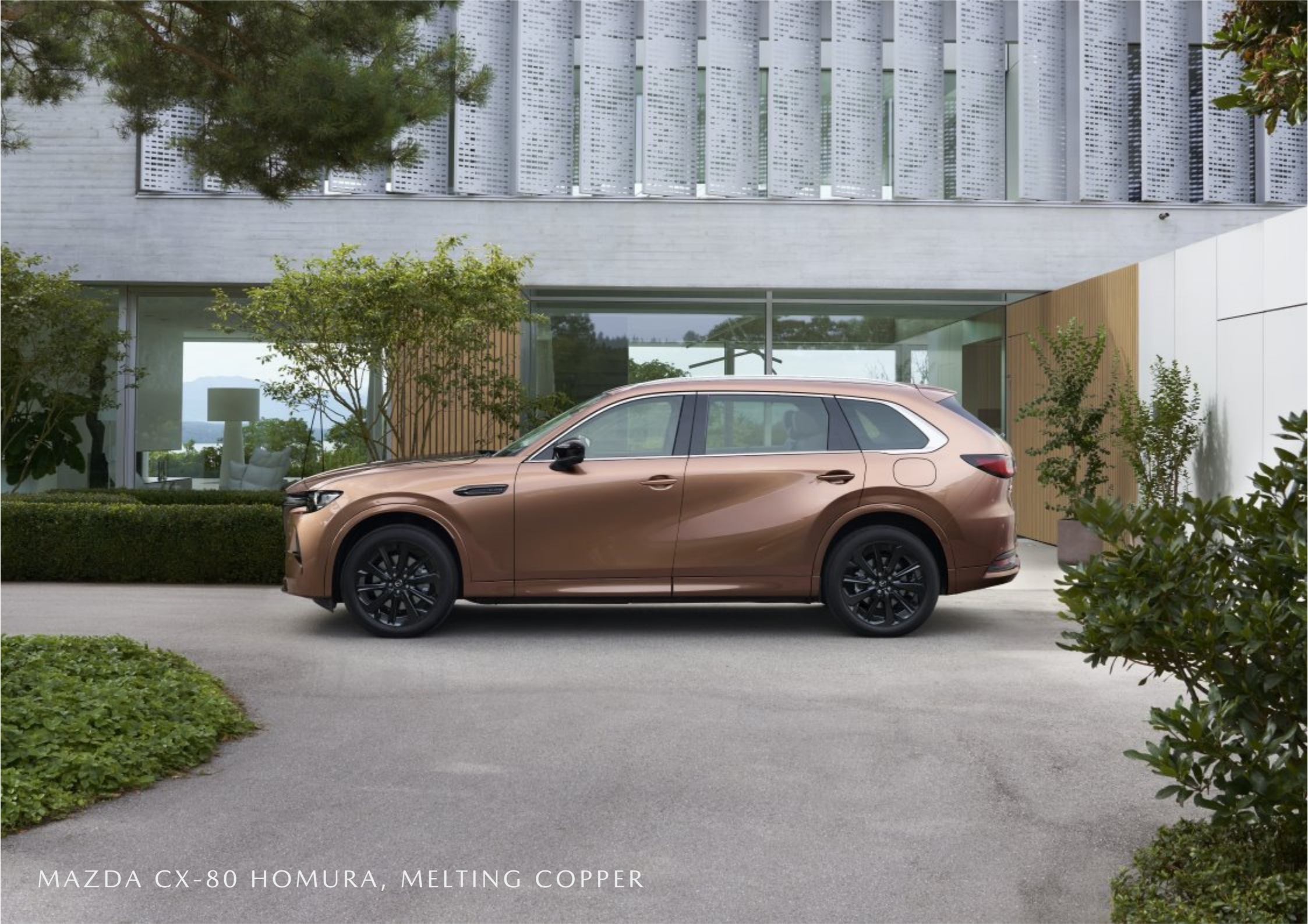
MAZDA CX-80 HOMURA, MELTING COPPER