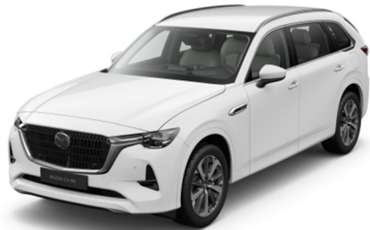
A4D Arctic White

Варианты цвета Metallic по дополнительному заказу (цена — 800 евро)