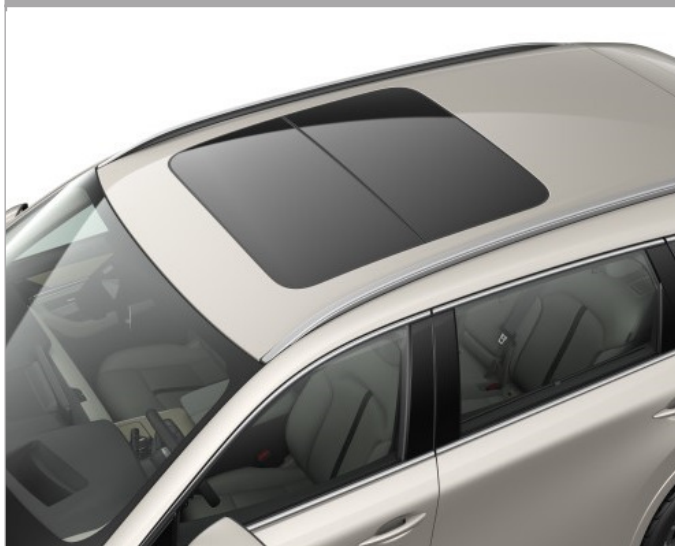
ПАНОРАМНЫЙ ЛЮК НА КРЫШЕ