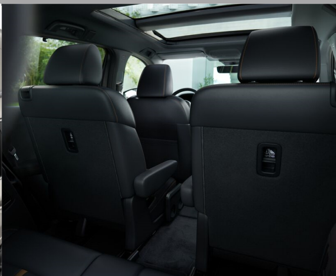
CAPTAIN SEAT HOMURA (6-МЕСТНЫЙ + ПРОХОДНОЙ)