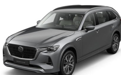
46G Machine Gray