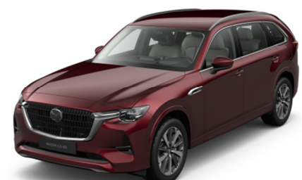
51F Artisan Red