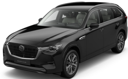
41W Jet Black

Варианты цвета Metallic по дополнительному заказу (цена — 800 евро)