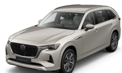
47S Platinum Quartz

Варианты цвета Premium Metallic по дополнительному заказу (цена — 1000 евро)