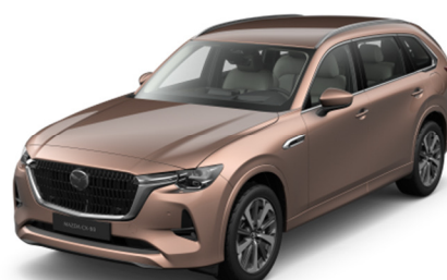
52H Melting Copper