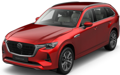
46V Soul Red Crystal