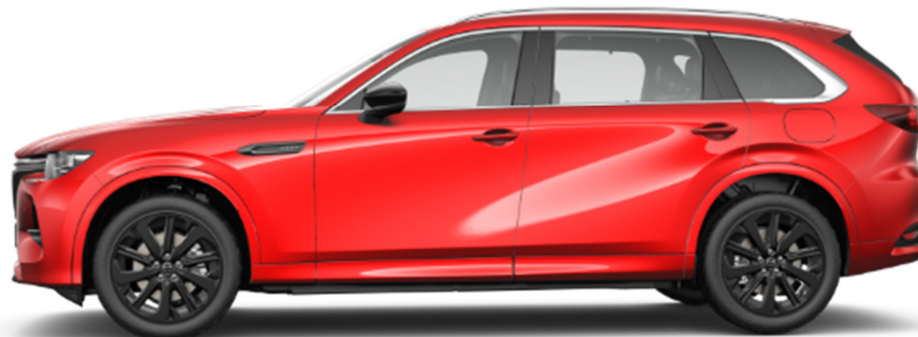
20-дюймовые черные легкосплавные колесные диски (235/50R20)