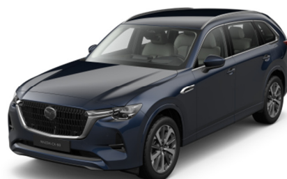
42M Deep Crystal Blue